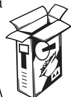
Όλα τα είδη χαρτί και χαρτονιού