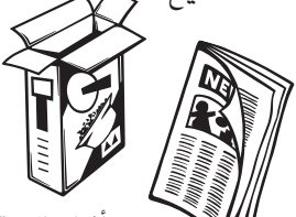
جميع أنواع الورق والكرتون