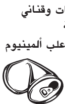
مرطبات وقناني زجاجية علب ألومنيوم