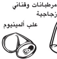
مرطبات وقناني زجاجية